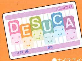
●ナイスエイジカード