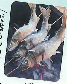
天然あゆの塩焼き