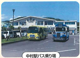
中村駅バス乗り場