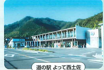
道の駅 よって西土佐